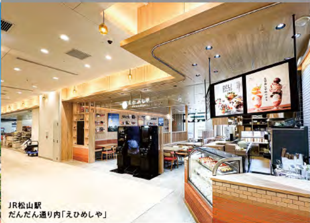
JR松山駅 だんだん通り内「えひめしや」