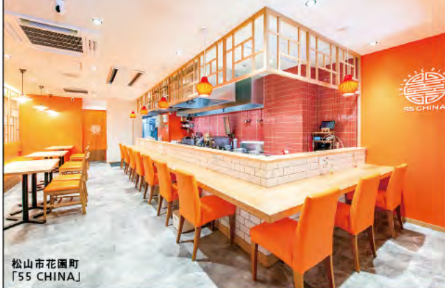
松山市花園町 「55 CHINA」