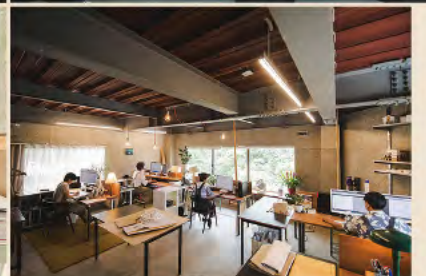
木毛セメントなど荒削りな素材を使いながらも、ヨーロッパピアノでシャギーな空気を醸し出しているオフィス空間。あちらこちらに置いたグリーンのケアなど、日常の営みを楽しみながら「場を編む」という作業に向かい合う