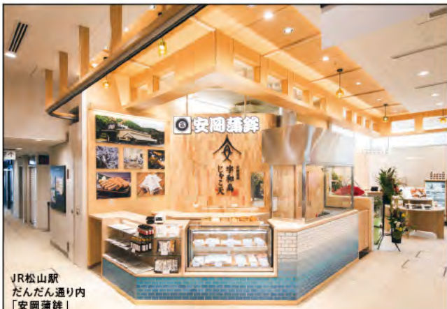
JR松山駅 だんだん通り内 「安南蒲餅」