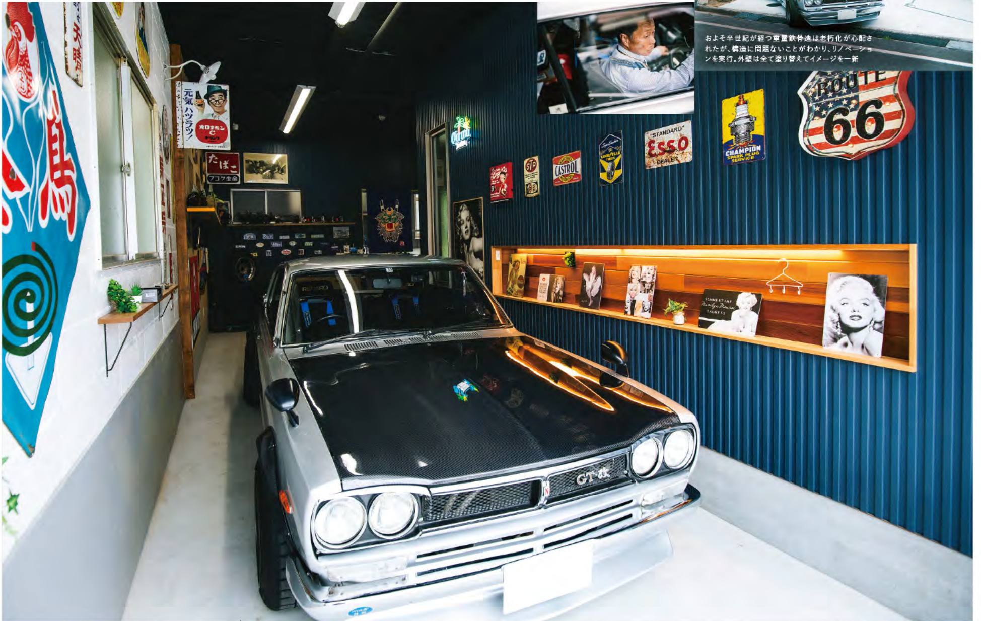
1960~70年代のホーロー看板が馴染むガレージ。ガルバリウム鋼板の側には木目のニッチを造り、お気に入りのアイテムをディスプレイ

(左) ガレージの奥に仲間と語り合う土間スペースを設けた。囲炉裏を置いた小上がりは、昔懐かし昭和にタイムスリップしたよう (右) 2階は和室2部屋をLDKに。天井の木材や建具などはそのまま残し、レトロな雰囲気に合わせてテレビボードなどを造作した