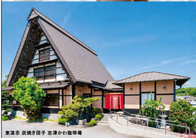
東温市 炭焼き団子 志津かわ珈琲庵

繁盛店を造ること それがユイファクトリーの 仕事です。 繁盛店造りは、 施主様の想いを共有することから始まります。 しっかりとヒアリングさせて頂き 想いを膨らますことで、 愛着を持って自慢したくなるお店が出来上がり、 来店されたお客様にとって 居心地の良い空間につながります。 レストラン、美容室などのお店造りをはじめ、 ジャンルにとらわれず 様々な店舗造りの経験があるからこそ ご提案できるデザインがあります。