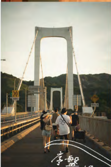
伯方島から見近島への移動にカートは必須！成人男性でも歩いて20分ほどかかる。水分補給や休憩を細目にとろう。